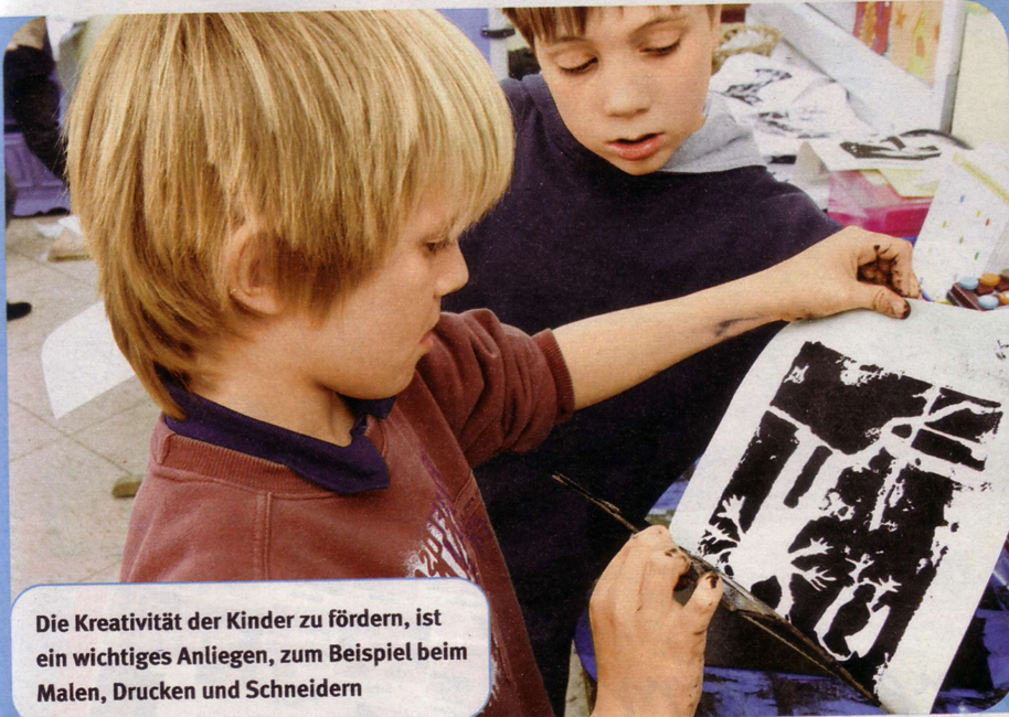
Die Kreativität der Kinder zu fördern, ist ein wichtiges Anliegen, zum Beispiel beim Malen, Drucken und Schneiden