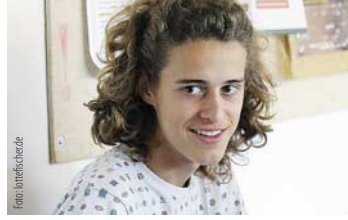
Jugend, 13–19 Jahre

Drei große Entwicklungsabschnitte sind auf dem Weg zum Erwachsenenalter zu beobachten: