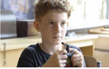
Kindheit, 6–14 Jahre