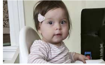
Frühe Kindheit, 0–7 Jahre